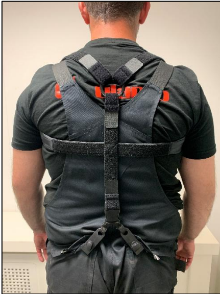
BackLock vastgemaakt aan een overall/tuinbroek